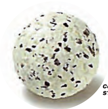
Cod. H701720 STRACCIATELLA