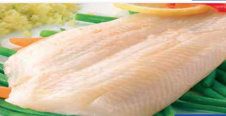
5013 FILETES DE PANGA (Gallo) Bolsa 1 K.