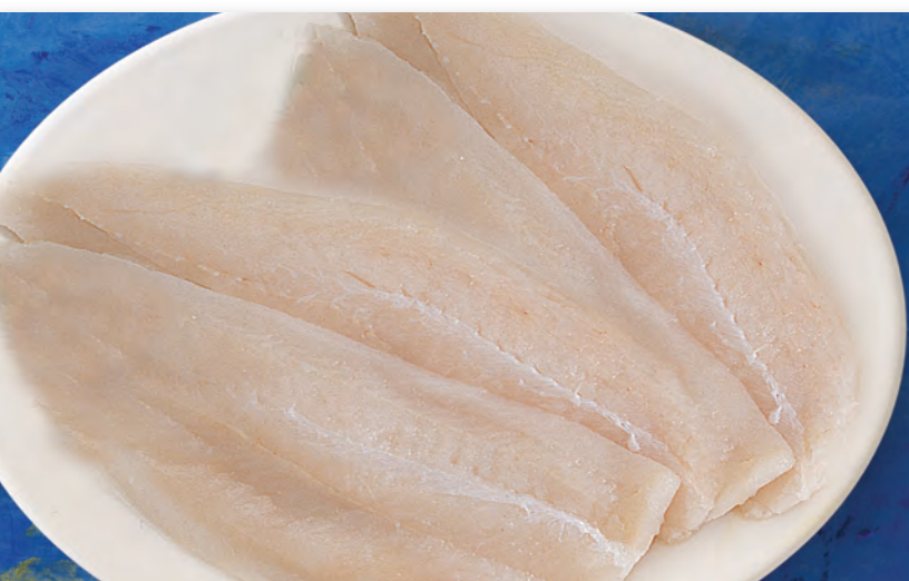
9030 FILETES DE MERLUZA sin piel 1 Kg.