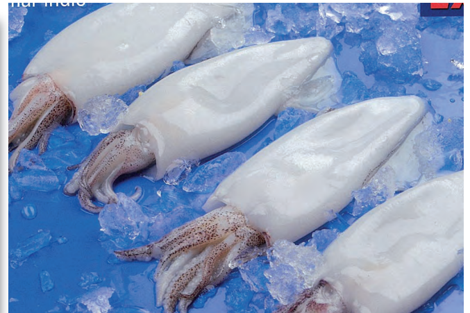
9003 CALAMAR LIMPIO NATURAL B/1 KG.