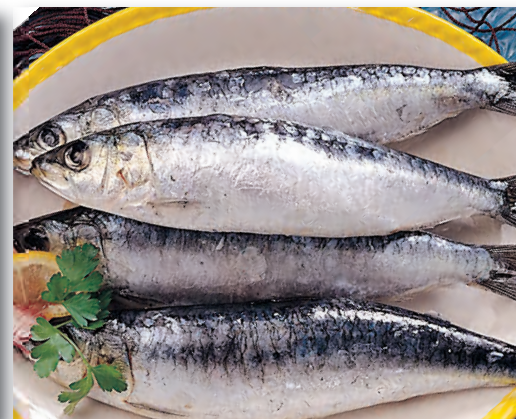
0243 SARDINAS 1 kg.