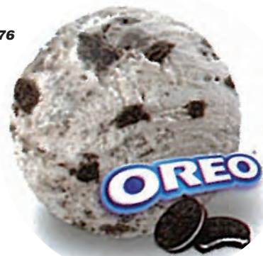
Cod. H735601 NATA CON OREO