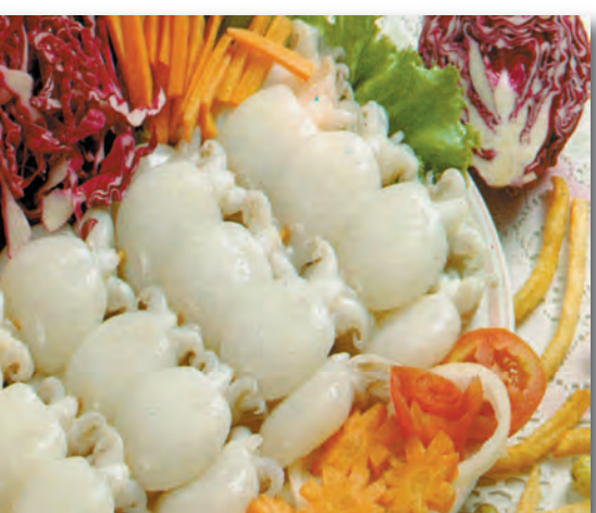
3552 BROCHETAS DE SEPIA 1 KG.