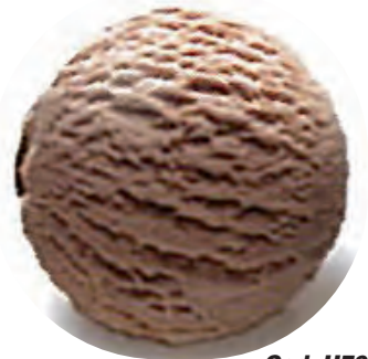
Cod. H701090 CHOCOLATE