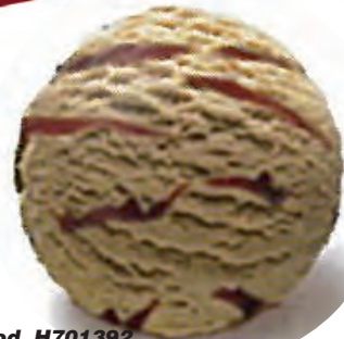
Cod. H701392 DULCE DE LECHE VETEADO