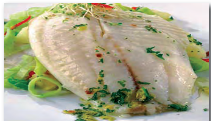
2257 FILETES DE TILAPIA (Besugo) B/1K.