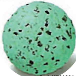
Cod. H701001 MENTA CON CHOCOLATE