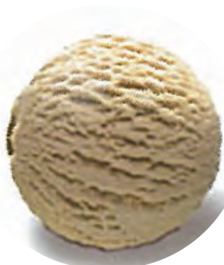
Cod. H706756 TURRÓN