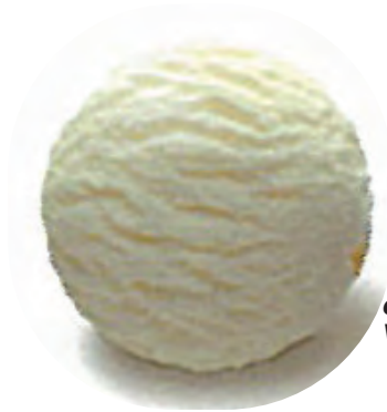
Cod. H701825 VAINILLA