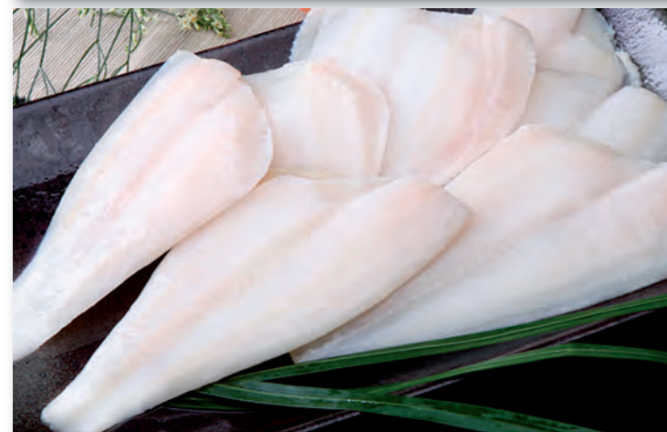
5015 LIMANDA FILETES B/1 K. sin piel y sin espinas