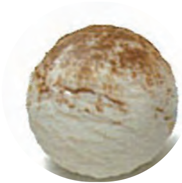
Cod. H701385 LECHE MERENGADA