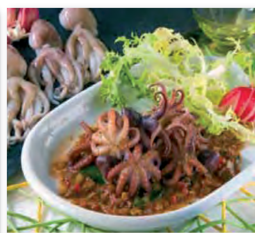
0260 PULPITO LIMPIO ESPECIAL PARRILLA 1 KG.