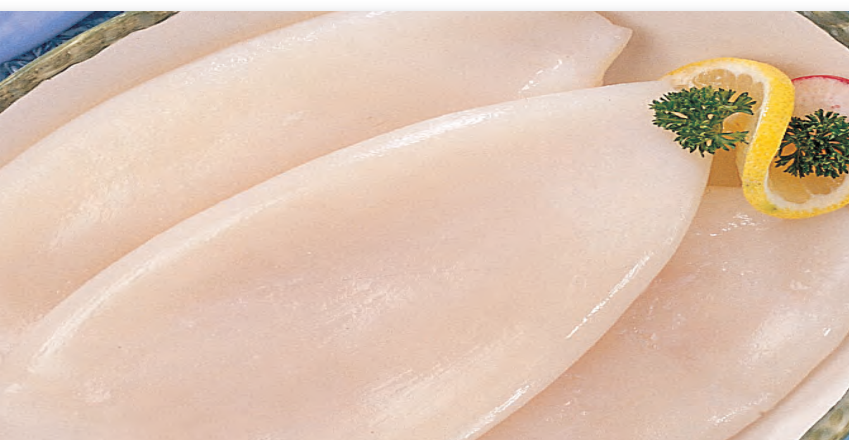
9023 TUBO DE CALAMAR LIMPIO Bolsa 4/6 uds. 1 Kg.