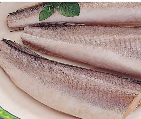
5026 PESCADILLAS SIN CABEZA (Tronquitos) Bolsa 4 / 6 uds. 1 kg.