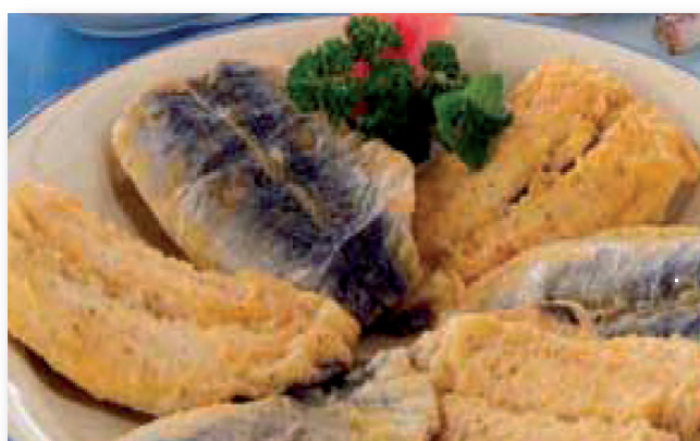
0343 FILETES DE SARDINAS Bolsa de 360 grms.