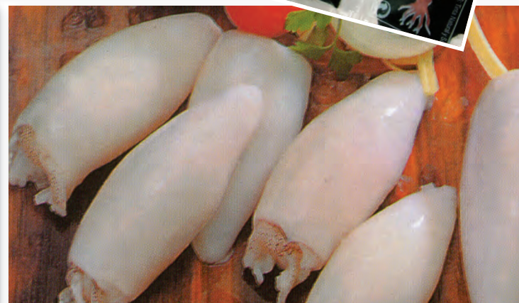
9026 CHIPIRÓN RELLENO B/1 k.