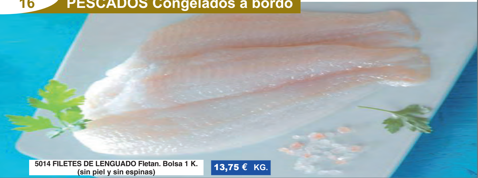
5014 FILETES DE LENGUADO Fletan. Bolsa 1 K. (sin piel y sin espinas)