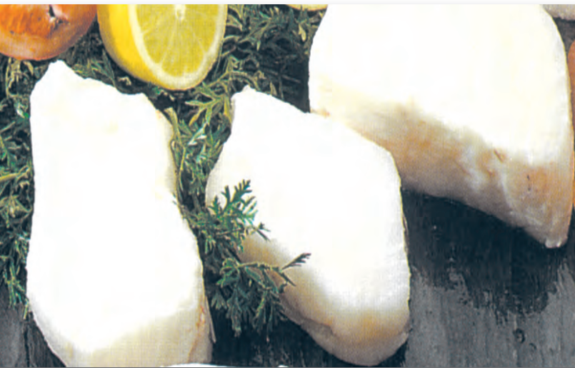
9019 LOMOS DE RODABALLO (Halibut) s/piel ni espinas 1 K.