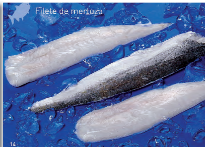
Filete de merluza