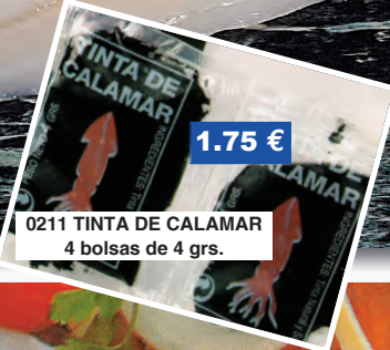
0211 TINTA DE CALAMAR 4 bolsas de 4 grs.