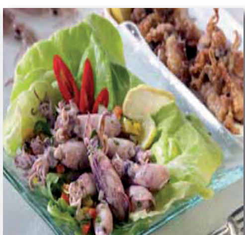
0176 CHOPITOS DE CALAMAR 1 Kg. (2x500)