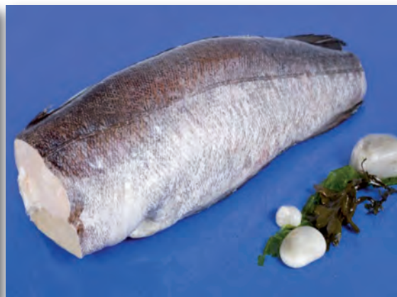
5012 COLAS DE MERLUZA Bolsa 1 kg. (3-4 piezas)