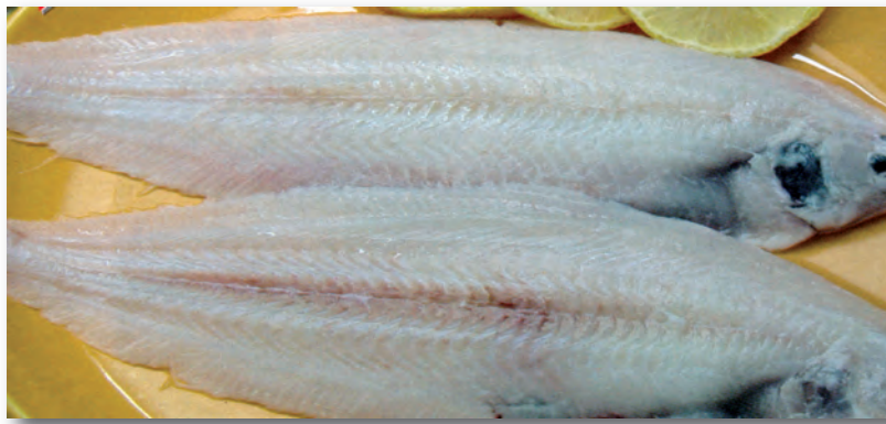
5115 LENGUADO GRANDE HOLANDES pelados - Bolsa Aprox. 1 kg. 3/5 piezas