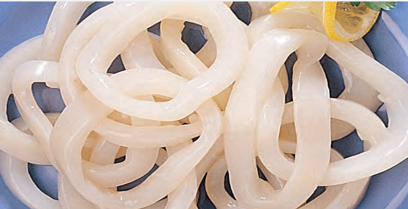
9002 CALAMAR ANILLAS - 1 KG.