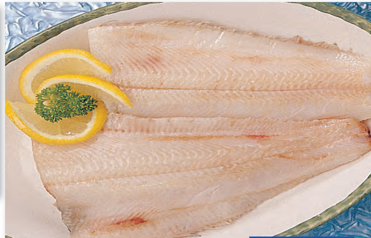
7128 LENGUADO - PLATIJA- Bolsa 4/6 unds. 1 K.