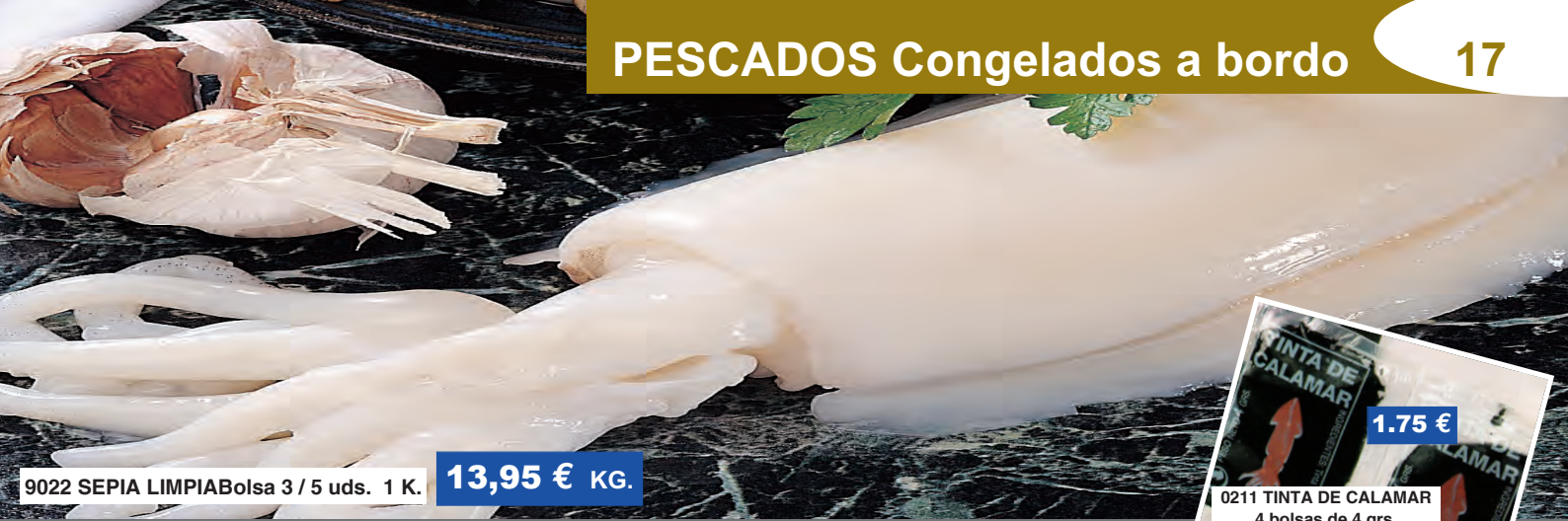
9022 SEPIA LIMPIA Bolsa 3 / 5 uds. 1 K.