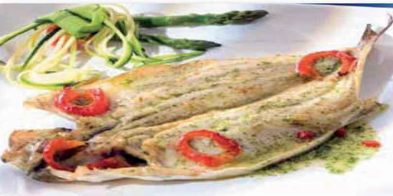
5042 LUBINA abierta pieza 200/300 gramos (ración) (14,50 €/kg)