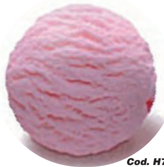
Cod. H704176 FRESA